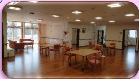
↑リビング・ダイニング レクリエーションルーム→